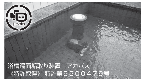
浴槽湯面垢取り装置 アカパス 《特許取得》特許第5500479号

浴槽水面の垢や髪の毛の除去、また、オーバーフローにより捨てる水にかかるコスト問題が、アカパスを吸水口に設置する事でコスト削減に繋がります。併せてレジオネラ属菌、ノロウイルス等の浴槽感染対策ができます。