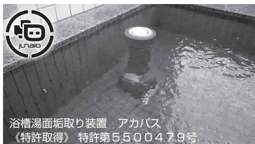
浴槽湯面垢取り装置 アカパス 《特許取得》特許第5500479号

浴槽水面の垢や毛髪の除去、また、オーバーフローにより捨てる水にかかるコスト問題が、アカパスを吸水口に設置する事でコスト削減に繋がります。併せてレジオネラ属菌、ノロウイルス等の浴槽感染対策ができます。